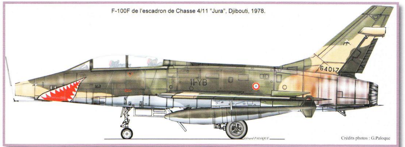
F-100F de l'escadron de Chasse 4/11 "Jura", Djibouti, 1978.

Avant cette transformation sur Jaguar, est créé en 1973 l'escadron de chasse 4/11 « Jura » qui sera équipé de F-100D et F et sera basé sur la BA-188 de Djibouti, seul escadron de chasse basé outre-mer. En 1978 les F-100 terminèrent leur carrière à Djibouti et sont remplacés par des Mirage IIIC. Les F-100 ne volent plus sous cocardes françaises.